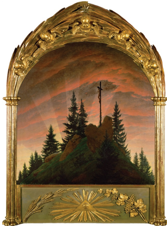
Altar de Tetschen, La cruz en la montaña Museo Staatliche Dresden