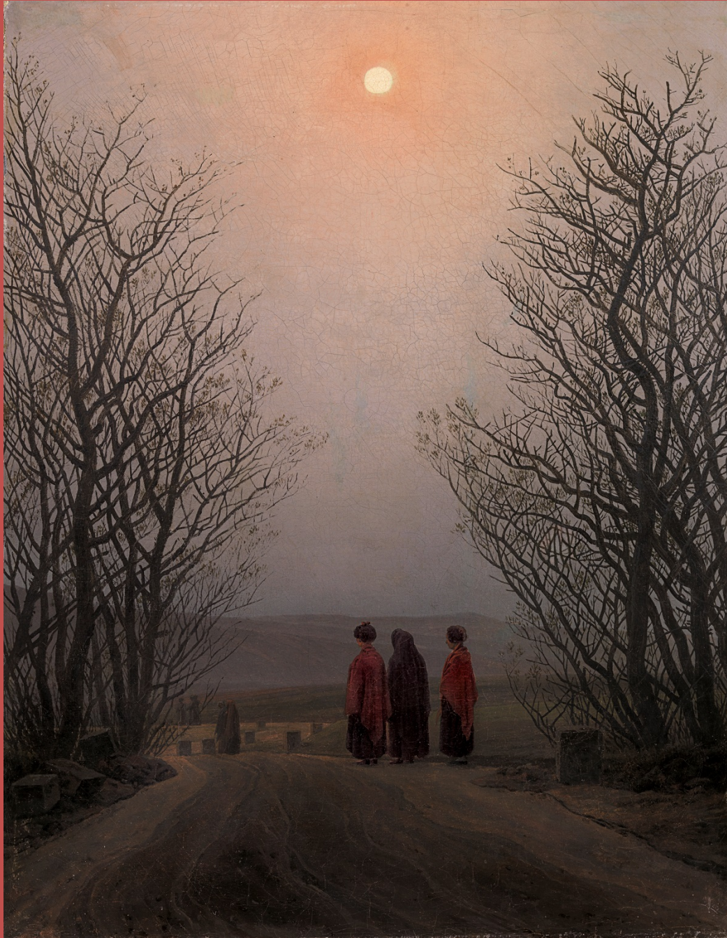
Mañana de Pascua 1828 - 1835 Óleo-lienzo 43,7 x 34,4 cm