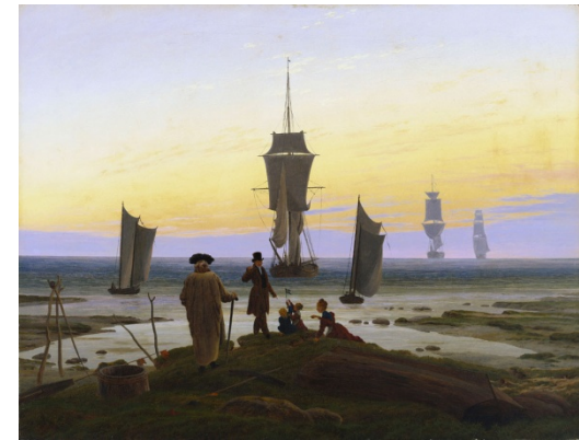
Las edades de la vida Museo Der bildenden Künste