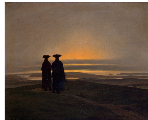
Atardecer, Museo Hermitage