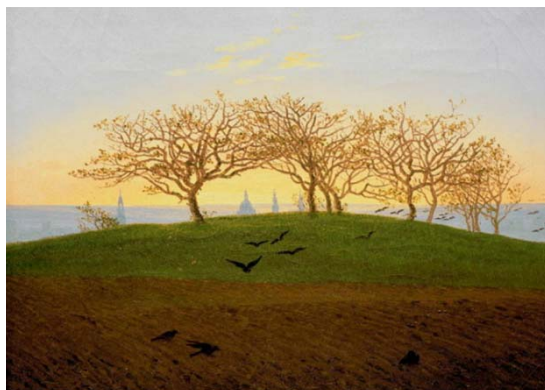
Colina con campo arado, cerca de Dresde