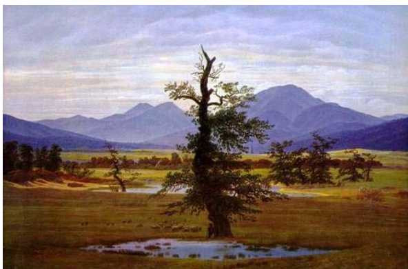
El árbol solitario Antigua Galería Nacional de Berlín,