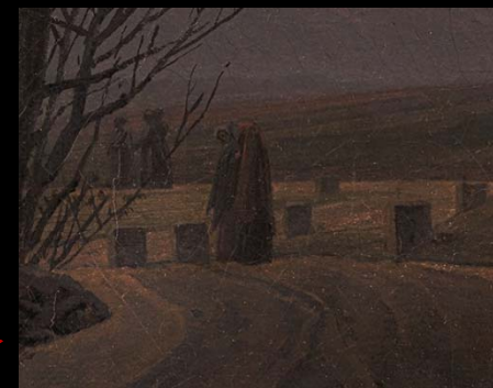
PIEDRAS JUNTO AL CAMINO Y MUJERES EN LA DISTANCIA