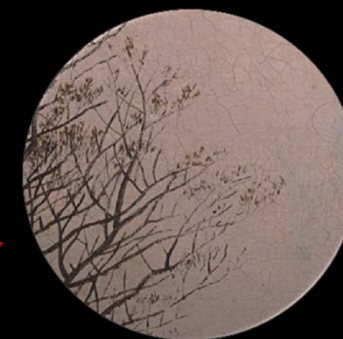
NUEVOS BROTES, PRIMAVERA