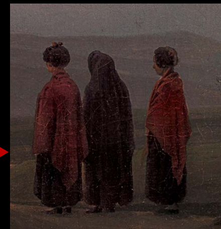
TRES MUJERES EN EL CAMINO