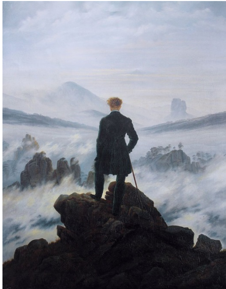
El caminante sobre el mar de nubes Museo Kunsthalle de Hamburgo