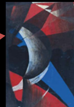
DINAMISMO Y CURVAS