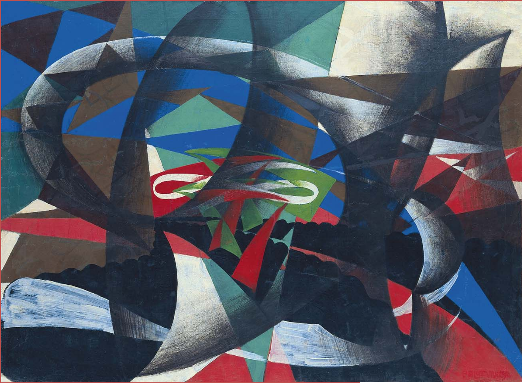
Manifestación patriótica 1915 Óleo sobre lienzo. 101 x 137,5 cm