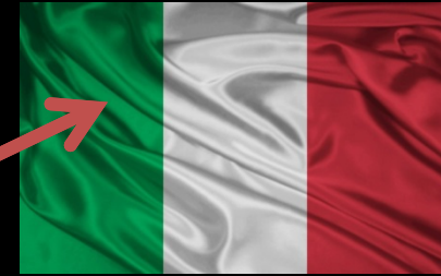
COLORES BANDERA ITALIANA