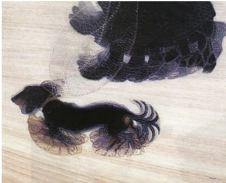
Dinamismo de perro con correa